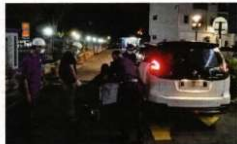
Wanita warga emas yang kudung sebelah kaki ditinggalkan seseorang dengan berkerusi roda bersama bekalan lampin pakai buang dan beg pakaian di tepi jalan di Kuala Langat pada malam Sabtu.