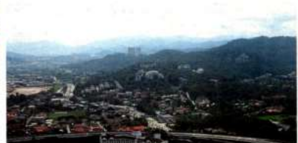
For Ampang residents, the Titiwangsa range and forest reserves are the main attraction that need to be protected.

With this in mind, the group recently launched its ajrimba.org website to educate