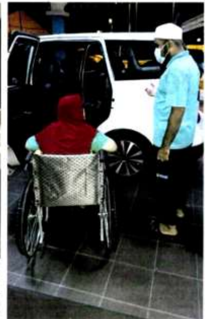
WANITA warga emas yang kudung kaki kini ditinggalkan di tepi jalan di jalan Keban disantuni LZS seterusnya dirumitkan di pusat jagaan warga emas.

"Hati mana tidak tersentuh apabila ibu ini masiti mendobakan yang terbaik untuk anaknya. Kata wanita itu (lah lama acik (maka) tak jumpa anak, anak acik baik orangnya. Kami cuba menyembunyikan rasa sebak di