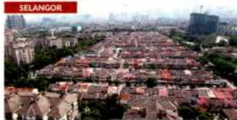
BANDING TOGETHER Ampang Jaya communities join forces to ensure future sustainable development in their area >4

By SHALINI RAVINDRAN shaliniravindran@thestar.com.my