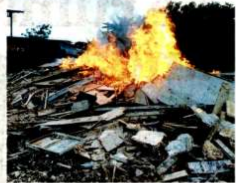
INDIVIDU yang melakukan pembakaran terbuka di kawasan perumahan boleh dikompaun sehingga RM2,000. – GAMBAR HIASAN

Selanjutnya, ia di bawah Perintah Kualiti Alam Sekeliling (Aktiviti yang disyiharkan) (Pembakaran Terbuka) 2003 setags mana IPU berada dalam status baik atau sederhana.