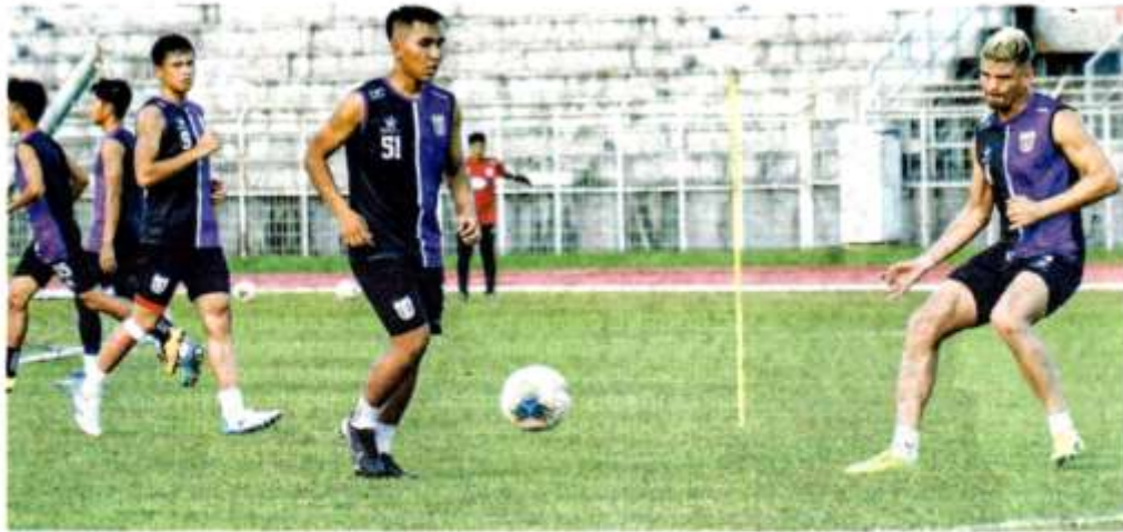
KUCHING City FC masih mencari venue untuk dijadikan laman sendiri ekoran Sarawak diklasifikasikan sebagai zon merah.