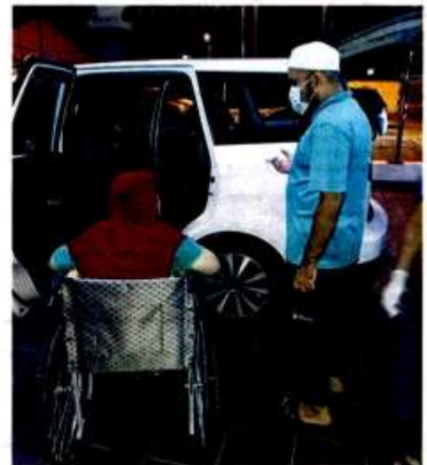
KAKITANGAN LZS melihat keadaan wanita yang ditinggalkan ahli keluarga di Balai Polis Sri Muda, Seksyen 25, Shah Alam kelmarin.

LZS kemudian tampil membantu usulan menerima maklumat mengenai seorang warga emas tidur di sebuah surau di Subang, dekat sini.