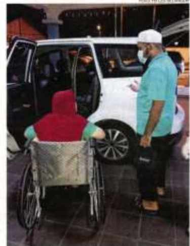
Skuad Saidina Umar Zakat Selangor dan Ketua Operasi Agihan Daerah Kuala Langat bertindak segera turun padang pada jam 8.30 malam Sabtu bagi menyantuni wanita yang ditinggalkan seorang diri di tepi jalan.

"Marilah sama-sama kita doakan semoga usaha ini mendapat keberkatan daripada ALLAH SWT dan ibu ini dapat dijaga dengan penuh kasih sayang," kata LZS.