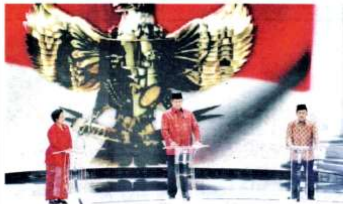
PARTAI Golongan Karya (Golkar) yang diasaskan pada 1964 adalah parti politik terbesar di Indonesia dari segi keanggotaan tetapi makin hilang taring selepas kejatuhan Suharto pada Mei 1998. Pada Pemilu 2019, Golkar hanya mampu meraih sekitar 12.31 peratus suara serta 85 kerusi Dewan Perwakilan Rakyat sahaja daripada keseluruhan 575 kerusi. (Gambar) Presiden Golkar, Jusuf Kalla (kanan) bersama dua calon Presiden Indonesia, Megawati Sukarnoputri dan Susilo Bambang Yudhoyono dalam program debat di televisyen pada 2009.