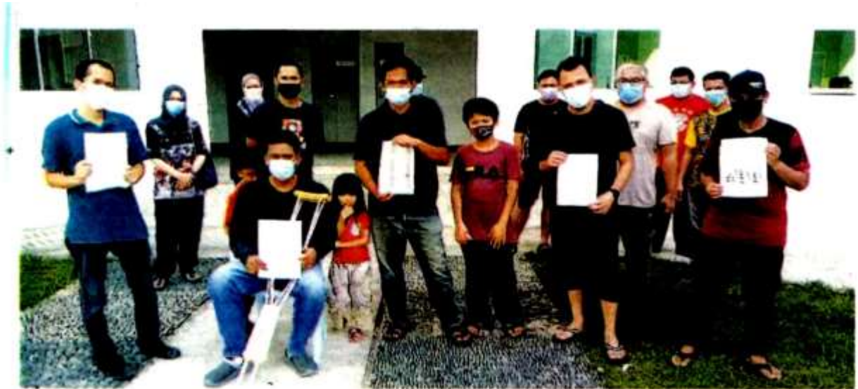
SEBAHAGIAN penduduk menunjukkan resit caj penyelenggaraan dikenakan terhadap mereka di Pangsapuri Kenangan, Seksyen 32 di Shah Alam baru-baru ini.