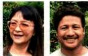
Noina says the group's priority is to empower residents to participate in the draft plan

Community group in Ampang Jaya formed to ensure folk have a say in draft plan, future projects